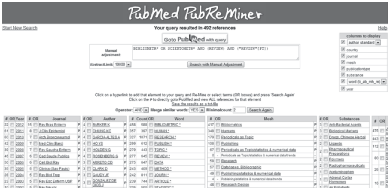
Figura 3. Revisiones bibliográficas (reviews) sobre ciencias médicas que utilizan ciencia métrica contenidos en PubMed. Se utilizó para el análisis la aplicación PubMed PubReMiner. http://hgserver2.amc.nl/cgi-bin/miner/miner2.cgi

ciencia métrica a la medicina, que se encarga de procesos estratégicos para las ciencias de la salud como la recuperación de información electrónica, el análisis de la literatura digital, la curación de colecciones bibliográfica, la construcción de nuevo conocimiento basado en el uso de minería de textos y semántica para la evaluación, la gestión y la política en temas de salud (Figura 3).