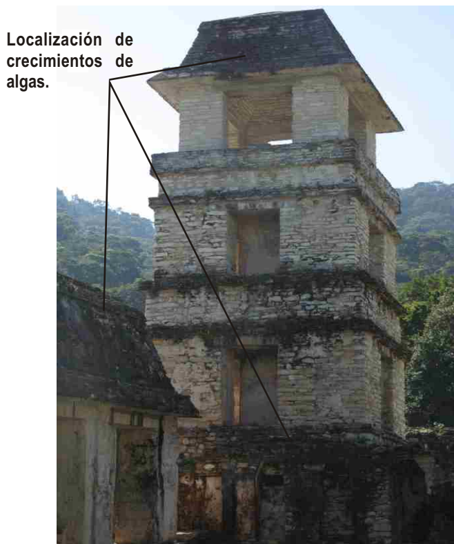
Figura 1. Depósitos de algas ubicadas en la Torre del Palacio.

Un tema que no se ha desarrollado mucho en el estudio de