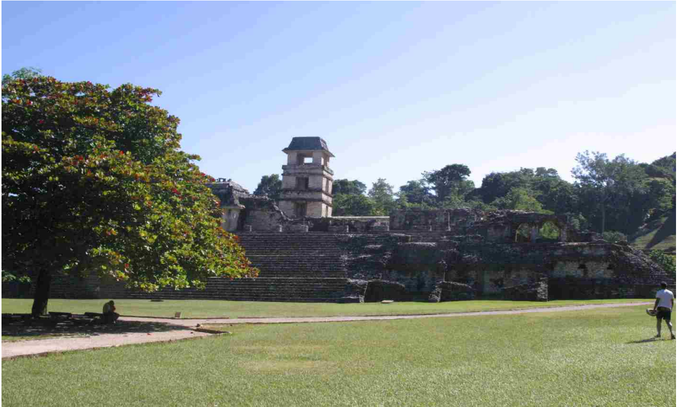
Vista general del Palacio de Palenque, notándose el desarrollo de algas en las áreas oscuras.