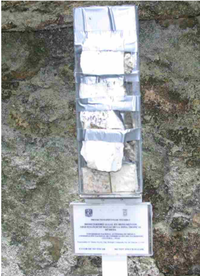
Figura 4. Detalle de la estación de monitoreo.

ahora son parte de complejos de especies mejor caracterizados.