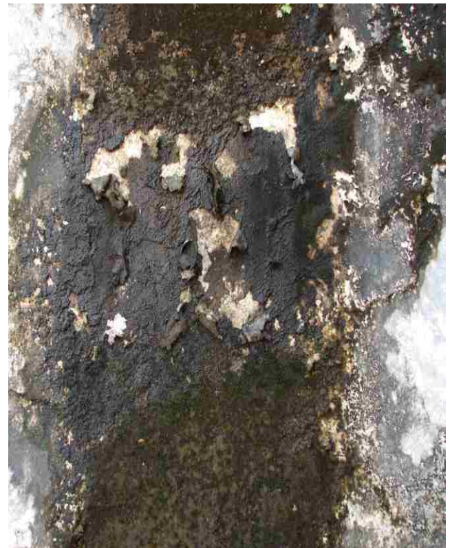
Figura 5. Crecimiento de Scytonema guyanense sobre un muro.

El desarrollo de las algas no puede evitarse en condiciones naturales pues las estructuras de resistencia, de dispersión e incluso las células vegetativas mismas están presentes en todas partes y son transportadas por cualquier medio (agua, aire, animales, etcétera).