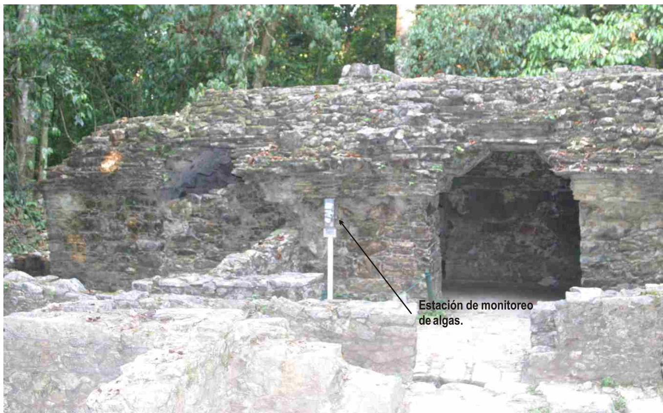
Figura 3. Estación de monitoreo de algas ubicada en el grupo Murcielagos de Palenque.

Torres (1991) registró para todo Palenque un total de 34 especies y esa es la principal referencia que existe a la flora del sitio. En cambio, Ramírez (2006) registró 16 especies dominantes (es decir, más abundantes) sólo del conjunto Palacio en el mismo lugar. Las diferencias numéricas podrían parecer irrelevantes a simple vista, sin embargo, hay que considerar que los criterios para la caracterización de las especies han cambiado considerablemente en los últimos años y algunas de las especies nombradas originalmente