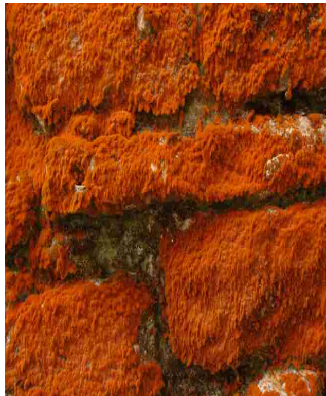
Figura 2. Crecimiento de algas sobre un muro ( Trentepohlia aurea ).

las algas que crecen en los monumentos históricos del mundo es de los efectos positivos, por lo tanto no existe documentación adecuada al respecto. Tres asuntos confluyen en este tema, la conservación de la biodiversidad, la educación ambiental y del entorno donde se ubican los sitios arqueológicos y los efectos estructurales.