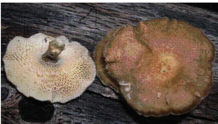
Figura 6. Polyporus arcularius , x 0.5.