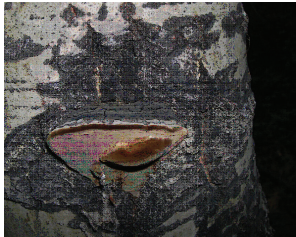
Figura 5. Phellinus tremulae , x 0.5.