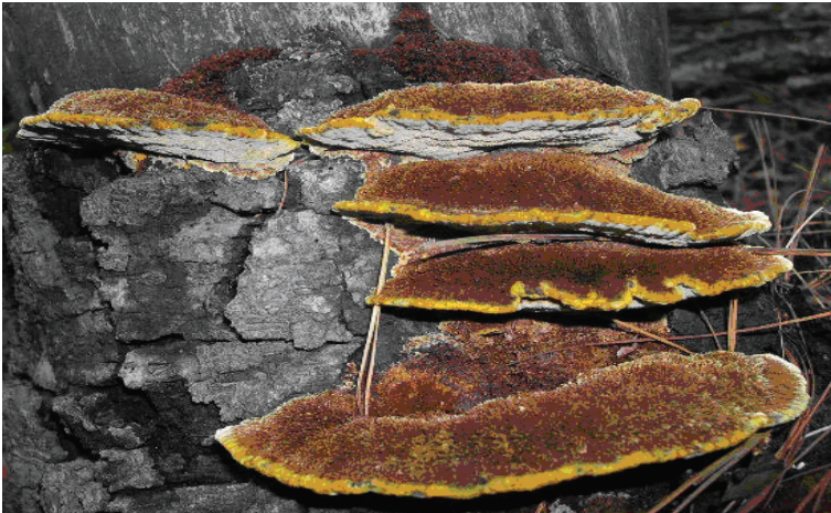
Figura 2. Inonotus fulvomelleus , x 0.5.