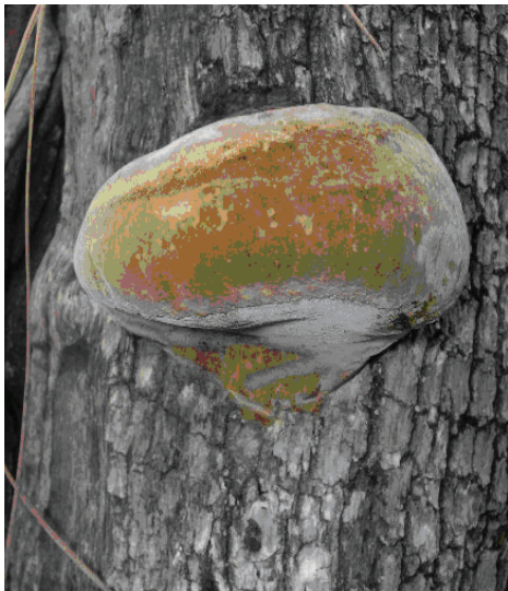
Figura 4. Phellinus robustus , x 0.2.