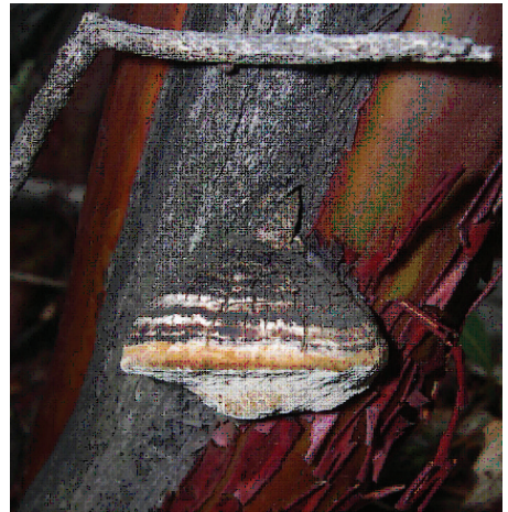
Figura 3. Phellinus arcostaphyli , x 1.