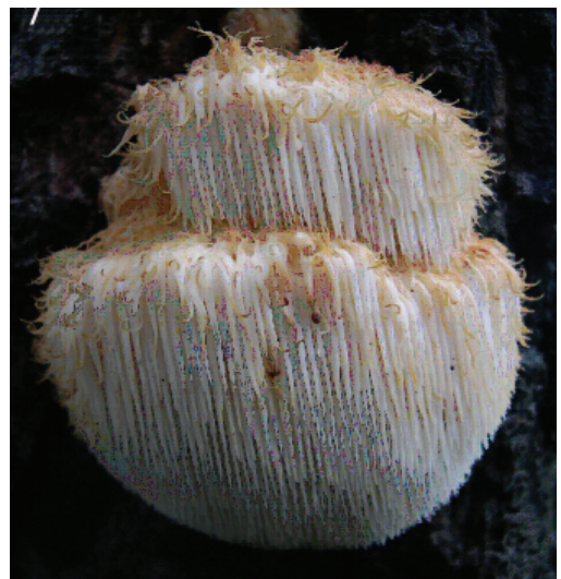
Figura 7. Hericium erinaceus , x 0.3.