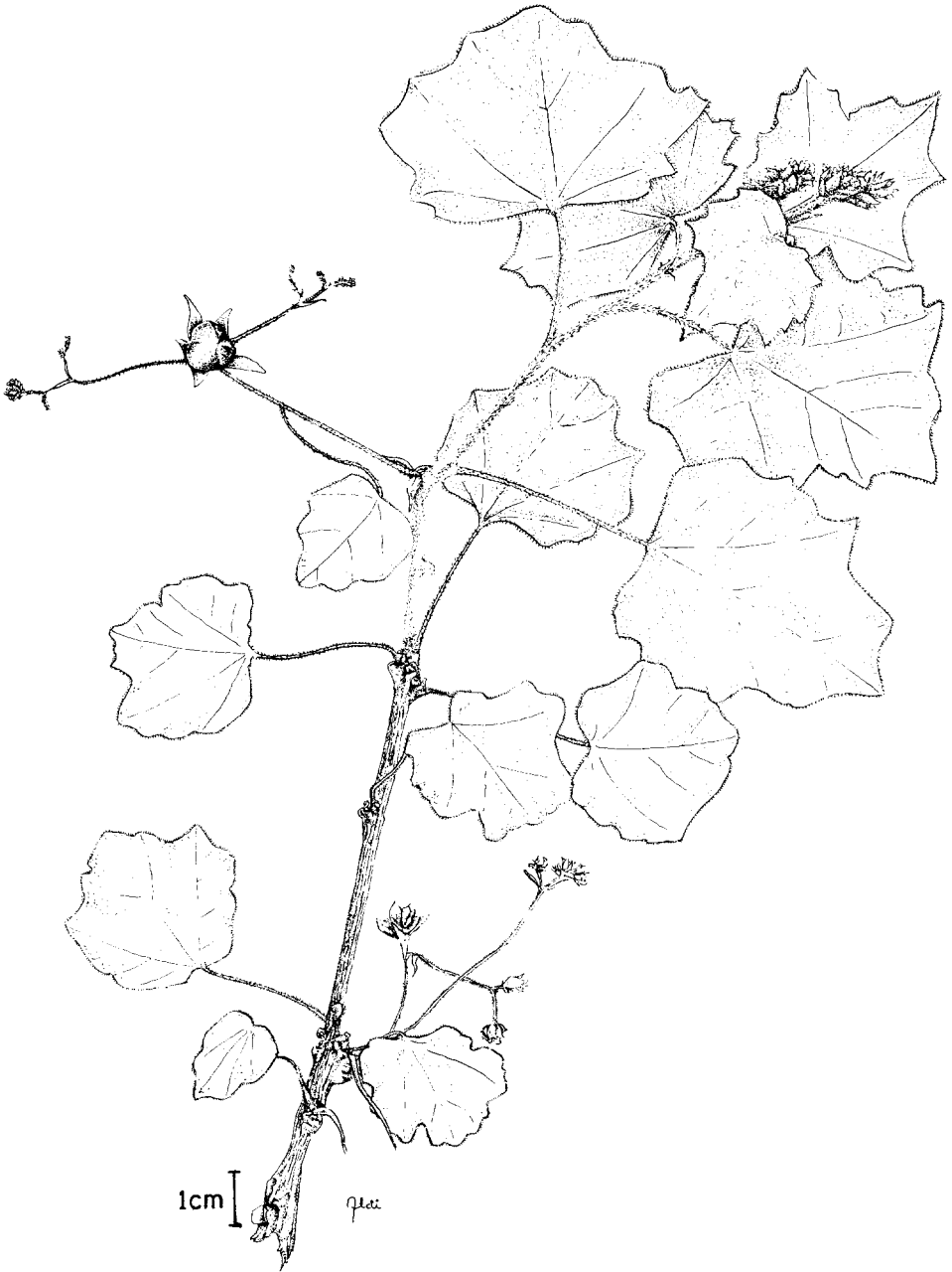
FIGURA 1. Jatropha websteri . Rama con inflorescencias (J. Jiménez R. 111).